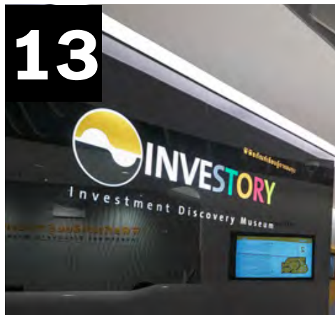
13 แนะนำ INVESTORY พิพิธภัณฑ์เรียนรู้การลงทุน