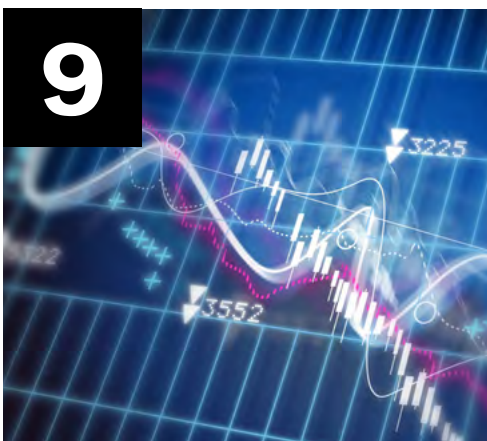
9 ความผันผวนของเราไม่เท่ากัน

15 Activities ทช. ฝึกอบรมอาชีพ จ.กำแพงเพชร และ จ.เชียงใหม่